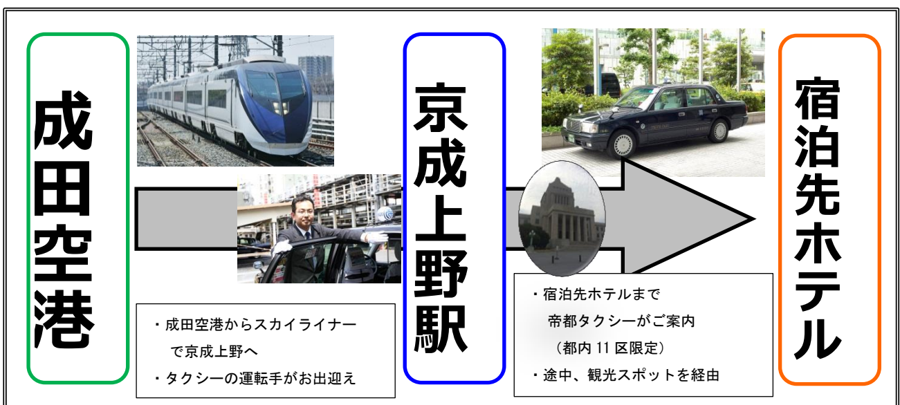
「KEISEI SKYLINER & TEITO TAXI」イメージ

京成グループでは今後も、グループシナジーを発揮し、訪日外国人のお客様に、日本でのご旅行をより便利で快適に、そして安心してお楽しみいただけるよう努めて参ります。