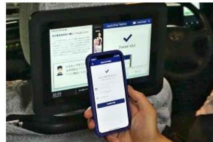
支払い手続きが完了します。