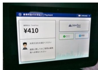
タブレット上の料金形態。