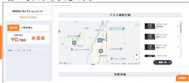
AIとドライブレコーダーの機能を活用して交通事故削減を支援する「DRIVE CHART」

「DRIVE CHART」は、街を縦横無尽に走行するタクシーや営業車、走行距離の長いトラックなど、プロの現場で多く採用される交通事故削減支援サービスです。従来のドライブレコーダーは録画が主な機能でしたが、「DRIVE CHART」は AI を活用し、運転の癖や気の緩みの他、脇見・車間距離不足・一時不停止・速度超過・急ハンドル・急加速・急減速・急後退など交通事故に繋がる可能性の高いリスク運転行動を自動検知し、衝撃や衝突警報などはリアルタイムでドライバー及び運行管理者に通知されます。その他の検知項目に関してもレポートに記録され、ドライバー自身と運行管理者は、場所と動画でリスク運転を振り返ることが可能となります。