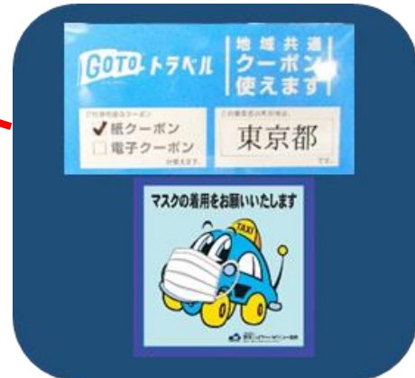
地域共通紙クーポン利用可能な車両には、左後ろの窓付近にステッカーを掲示

10月1日より、東京都でも利用が可能となる「地域共通クーポン」は、1枚1000円単位で発行する紙クーポンと、1000円、2000円、5000円の電子クーポンがあります。旅行者は、旅行期間中の都内と隣接した都道府県内で地域共通クーポンを使い、代金を支払うことができます。