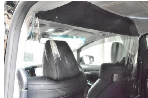
飛沫感染防止のための透明ビニールカーテン (ハイヤー)