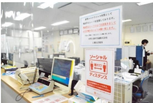
飛沫感染防止のための透明ビニールカーテン (営業所内)