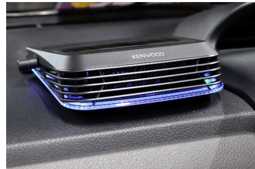
低濃度オゾン発生器(タクシー)