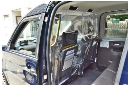
飛沫感染防止のための透明ビニールカーテン (タクシー)