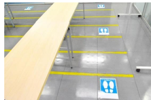
適切な距離を保つための印 (営業所内)