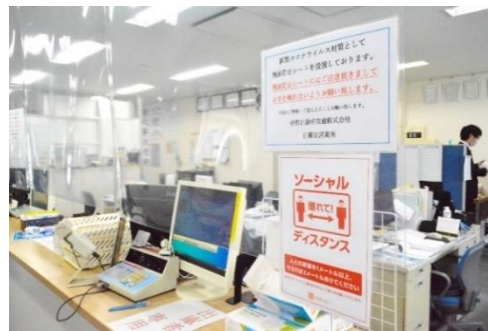
飛沫感染防止のための透明ビニールカーテン (営業所内)