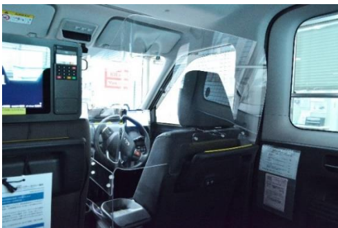
飛沫感染防止のためのシールド(タクシー)