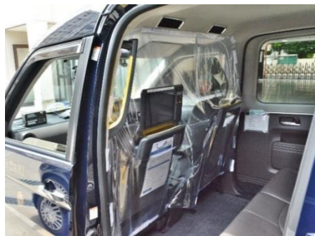
透明ビニールカーテン (タクシー)