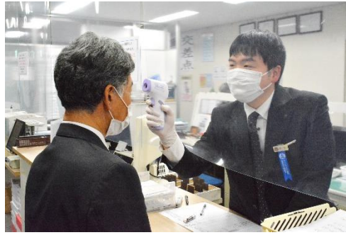
乗務前・乗務後の体温計測