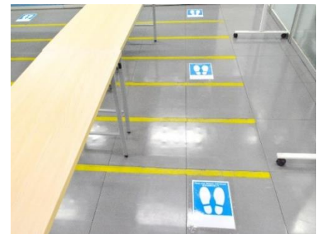
適切な距離を保つための印 (営業所内)