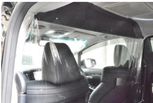
透明ビニールカーテン (ハイヤー)