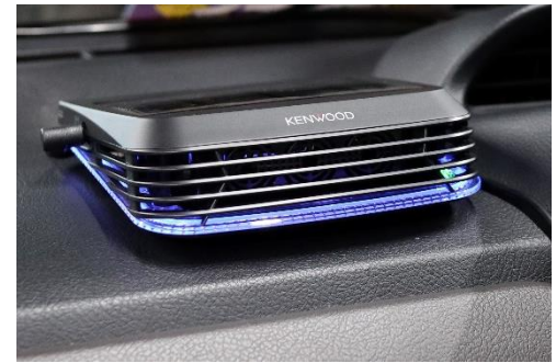
低濃度オゾン発生器(タクシー)