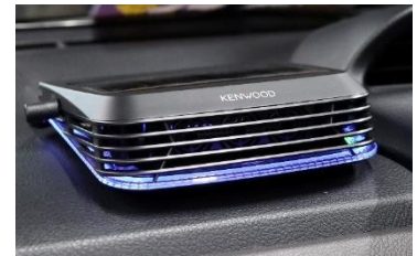
低濃度オゾン発生器

ニューノーマルタクシーとは、東京ハイヤー・タクシー協会がウィズコロナ時代の新常态に適合した移動空間の提供を目指して導入を推進する、新型コロナウイルス感染防止対策を強化した車両のことです。当社では、二酸化炭素濃度モニター、飛沫防止シールド、低濃度オゾン発生器を設置した車両を「ニューノーマルタクシー」とし、感染予防の徹底、安全運行に万全を期してまいります。