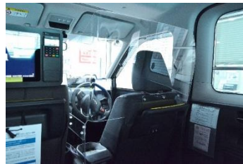
飛沫感染防止シールド