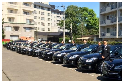
国際会議の運行に備えて並ぶ当社のハイヤー

当社は創業時よりハイヤー事業にも力を入れており、官公庁はじめ企業の経営者・役員の移動手段や海外VIPの送迎等、多くの実績を持っております。特に近年は、大規模な国際スポーツ大会の開催はじめ、今後利用の増加が予想される海外富裕層や、VIPの送迎のため、トヨタ新型センチュリーやハイエースグランドキャビンを特別仕様車として導入しております。