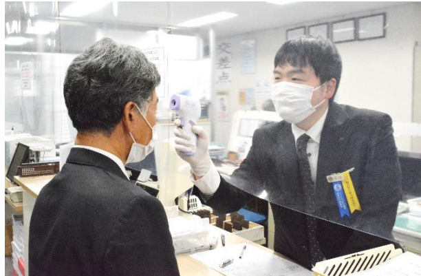
乗務前・乗務後の体温計測