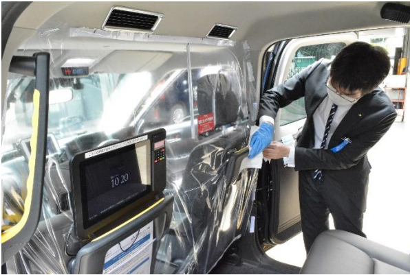
車内の消毒・除菌