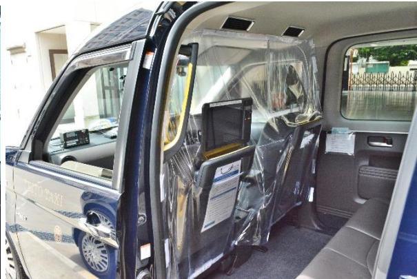
飛沫感染防止のための透明ビニールカーテン (タクシー)