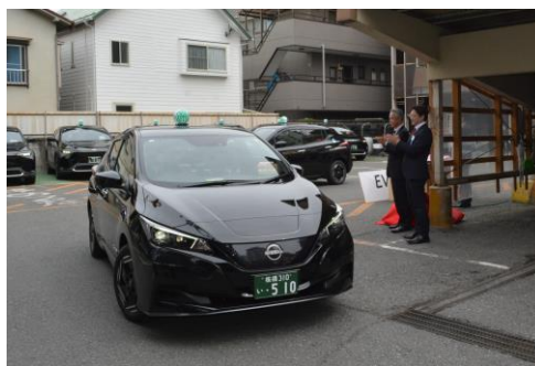
EV 車両出発式の様子

今般のEV(電気自動車)車両は、GO株式会社が進めている「タクシー産業GXプロジェクト」に参加し、提供を受けるもので、本プロジェクトを通じて得た走行データ等は、同社へ提供いたします。