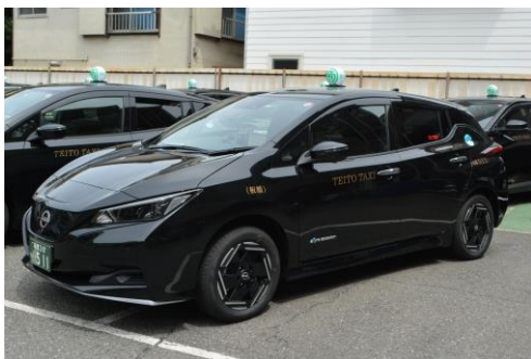
日産 リーフ e+X